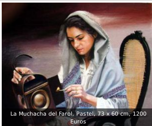
La Muchacha del Farol, Pastel, 73 x 60 cm, 1200 Euros